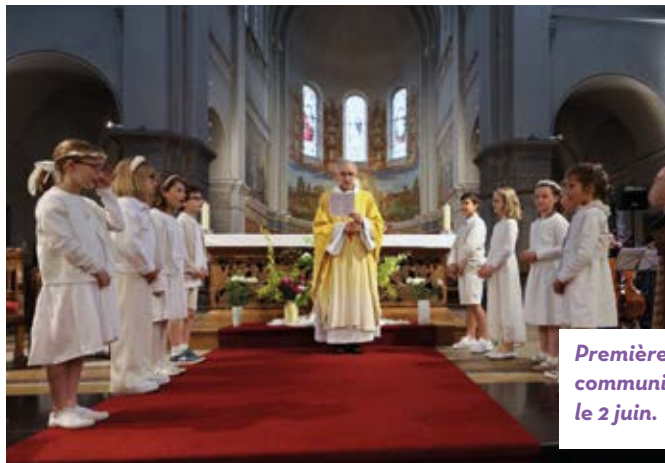
Premières communions le 2 juin.

Elle sera suivie à l'école maternelle Sainte-Anne-Saint-Joachim d'un barbecue de fin d'année. Vous êtes tous les bienvenus paroissiens ou habitants du quartier !