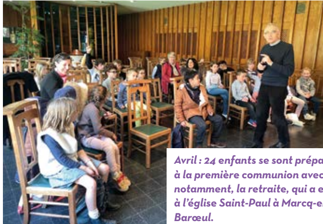
Avril : 24 enfants se sont préparés à la première communion avec, notamment, la retraite, qui a eu lieu à l'église Saint-Paul à Marcq-en-Barœul.