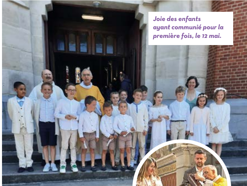
Joie des enfants ayant communiqué pour la première fois, le 12 mai.